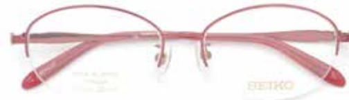
セイコーステラ [SE4017] フレーム価格 ¥22,000(税込) 日本製