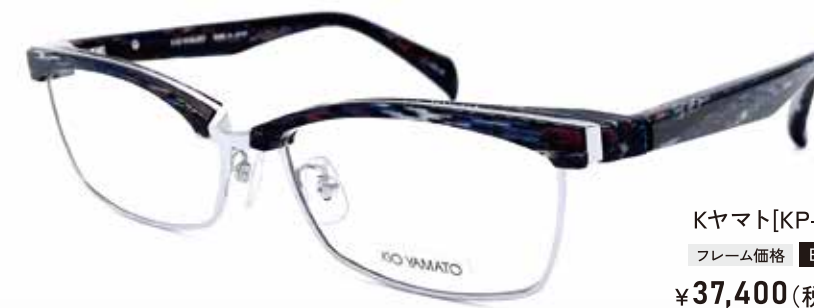
Kヤマト [KP-J29] フレーム価格 日本製 ¥37,400(税込)