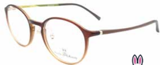
サイコバニー [PB-104] レンズ付き ¥11,000(税込)