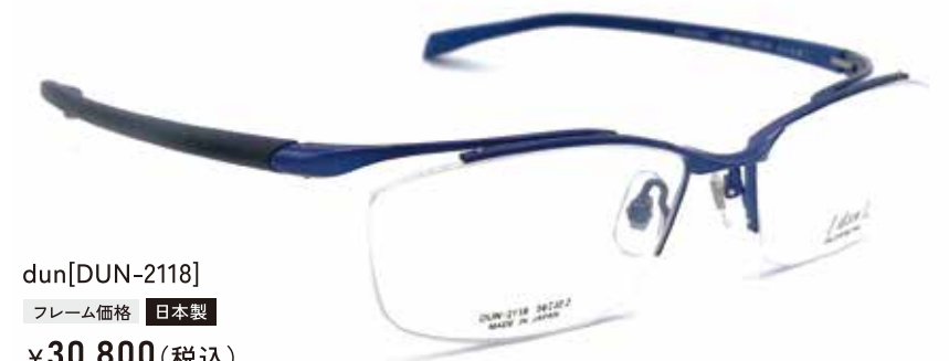
dun [DUN-2118] フレーム価格 日本製 ¥30,800(税込)