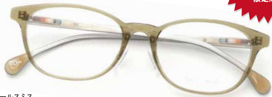
ポールスミス [PS-9492] フレーム価格 ¥15,950(税込) 日本製 元々 ¥31,900