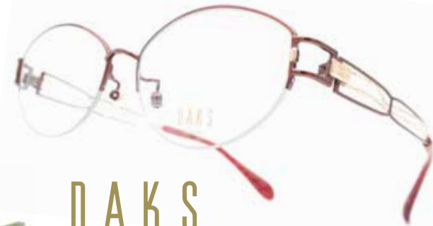
ダックス [DK-3006] レンズ付き ¥26,400(税込) 日本製