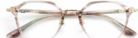
ヴィクター&ロルフ [70-0257-3] フレーム価格 ¥31,900(税込) 日本製