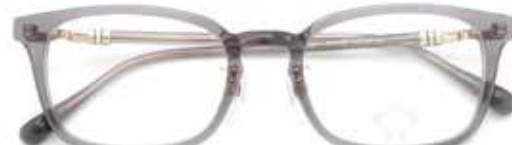
オロビオナコ [OB-537] フレーム価格 ¥29,700(税込) 日本製