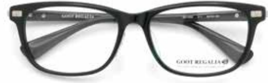
ゴートレガリア [GO-1002] フレーム価格 ¥13,200(税込)