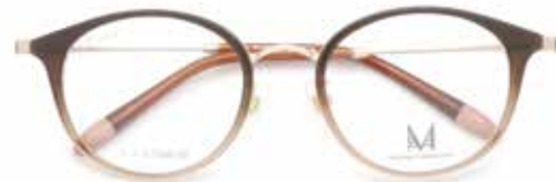
ミチヨバ [M.i.i-1012] フレーム価格 ¥16,500(税込)