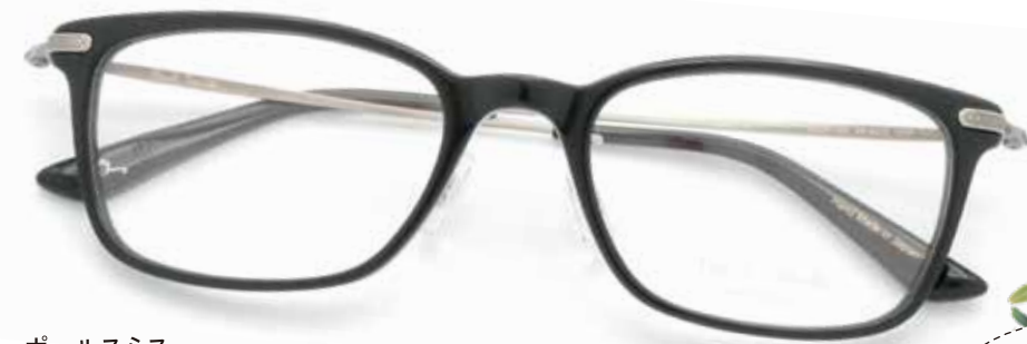
ポールスミス [PS-9470] フレーム価格 ¥19,250(税込) 日本製 元々 ¥38,500